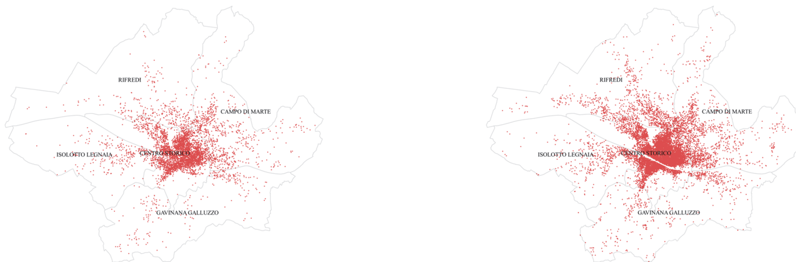
Fig. 4 - Distribuzione territoriale degli annunci relativi al comune di Firenze - Variazione 2015-2019