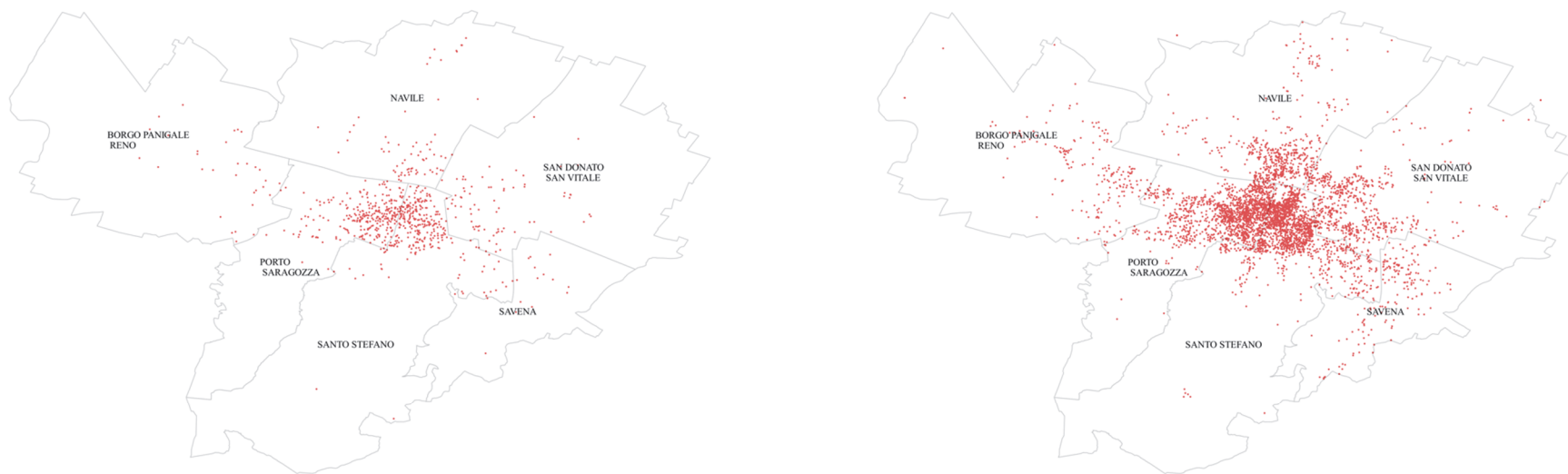
Fig. 3 - Distribuzione territoriale degli annunci relativi al comune di Bologna - Variazione 2016-2019

Fonte: dati Airbnb Data Collection; Insideairbnb.com; elaborazione nostra