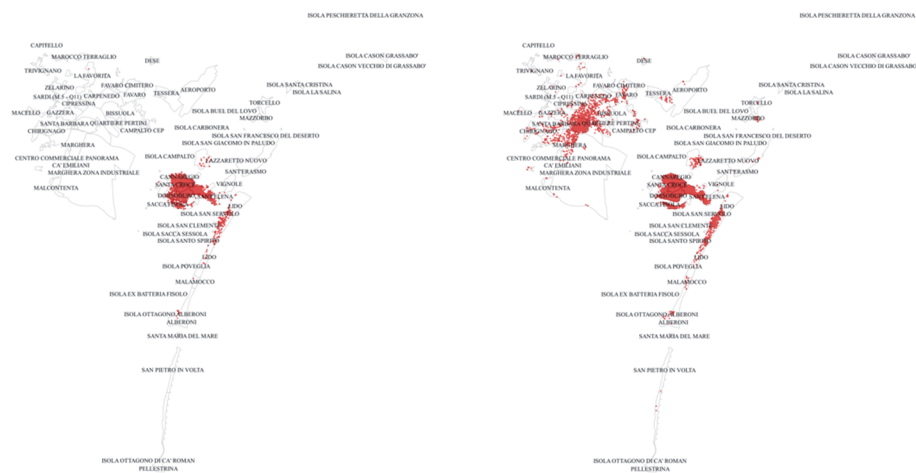
Fig. 2 - Distribuzione territoriale degli annunci relativi al comune di Venezia - Variazione 2015-2019

Fonte: dati Airbnb Data Collection; Insideairbnb.com; elaborazione nostra