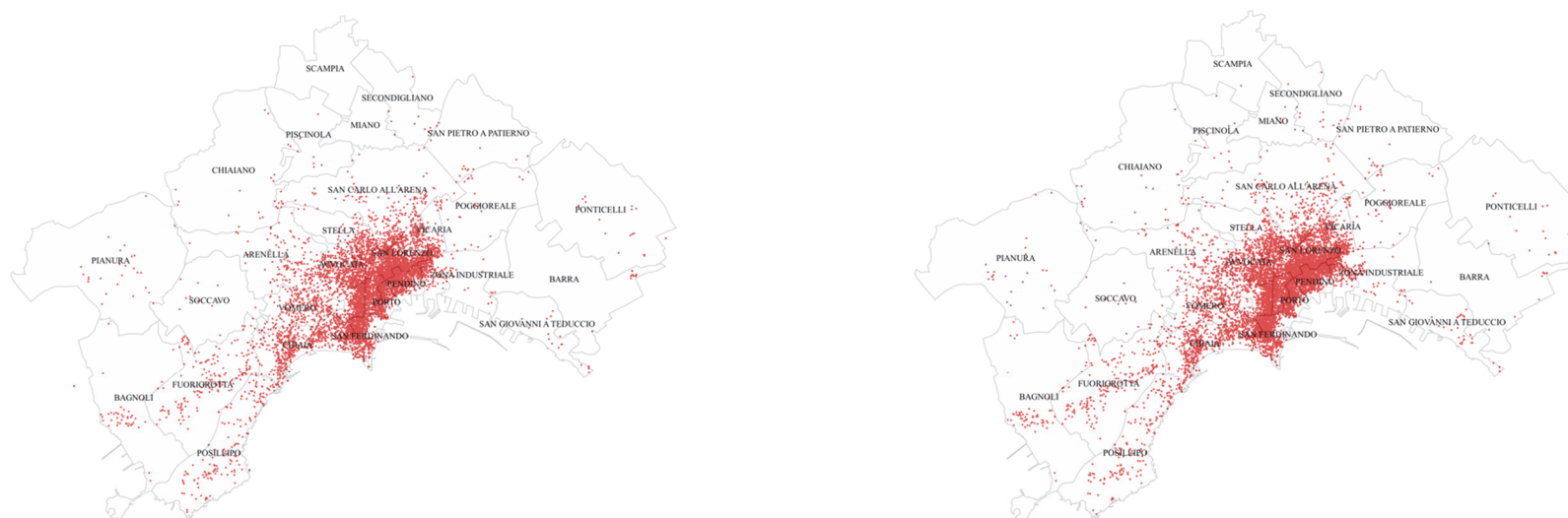
Fonte: dati Airbnb Data Collection; Insideairbnb.com; elaborazione nostra Fig. 6 - Distribuzione territoriale degli annunci relativi al comune di Napoli - Variazione 2018-2019

Fonte: dati Insideairbnb.com; elaborazione nostra