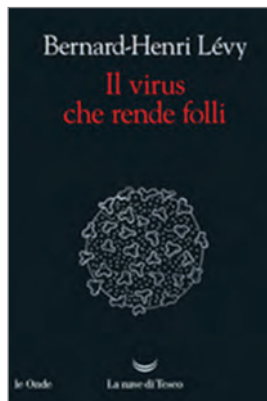
Bernard-Henri Lévy (2020) Il virus che rende folli , La nave di Teseo, Milano, p. 107, € 9,50