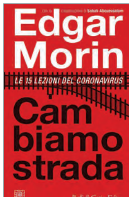
Edgard Morin (2020) Cambiamo strada. Le 15 lezioni del coronavirus , Raffaello Cortina, Milano, p. 121 € 11