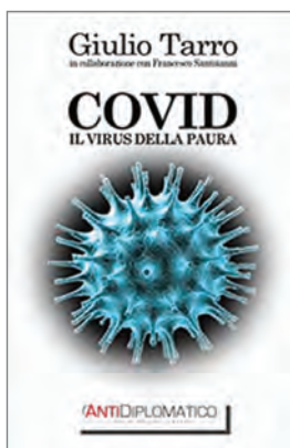
Giulio Tarro (2020) CO-VID Il virus della paura . Ilmiolibro self-publishing, printed by Amazon, p. 124 € 13,50