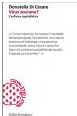
Donatella Di Cesare (2020) Virus sovrano? L'asfissia capitalistica , Bollati Boringhieri, Torino, p. 89, € 8,55