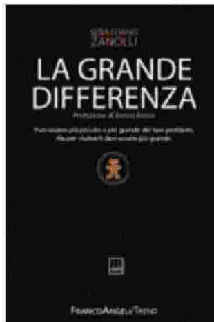
La copertina del libro