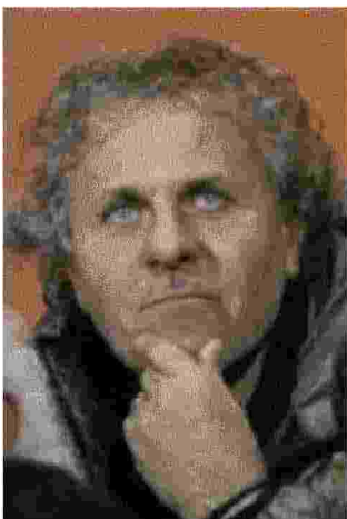
Renzo Rosso, imprenditore